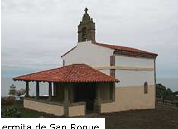
ermita de San Roque

Atractivo pueblo marinero con magníficas vistas, situado en la zona oriental de Asturias dentro del Concejo de Colunga y al costado de una gigante roca entre la playa y el pueblo. Declarado Conjunto Histórico Artístico el 7 de mayo de 1992. El nombre de Lastres no tiene claro su procedencia, pero se dice, se cuenta, se rumorea que tres familias dedicadas a la pesca edificaron tres casas para vivir, dado el lugar tan apropiado para su oficio o también por las grandes rocas relucientes que se denominan laxas , en lenguaje asturiano llastres .